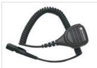
PMMN4075 Micrófono parlante remoto pequeño, windporting, IP57 No incluye botón de emergencia.