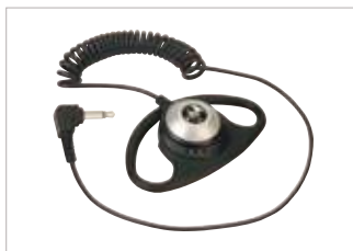
PMLN4620 Aurífono para recepción únicamente D-Shell.