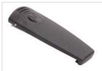
PMLN5616 Presilla para cinturón de 2".