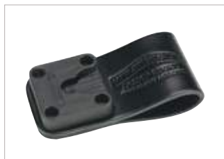
GMDN0566AC Presilla para cinturón de cuero Peter Jones (ILG) Klick Fast con puerto de montaje (50 mm); se conecta con dispositivo para hombro con sujetador Peter Jones (ILG) Klick Fast.