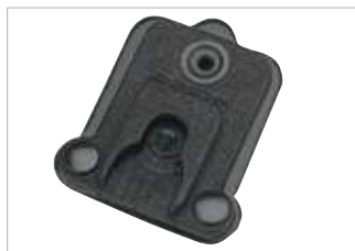
GMDN0547 Puerto de apoyo de doble lengüeta Peter Jones (ILG) Klick Fast; se conecta con dispositivo para hombro con sujetador Peter Jones (ILG) Klick Fast.