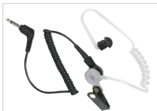
MDRLN4941 Aurífono para recepción únicamente con tubo translúcido y punta auditiva de goma.