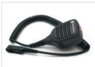
PMMN4072 Micrófono parlante remoto IMPRES grande; incluye micrófono con cancelación de ruido, mejor calidad de audio, entrada para audio y botón de emergencia, IP54.

USTED NECESITA LA MEJOR CALIDAD DE AUDIO POSIBLE PARA QUE SUS COMUNICACIONES PUEDAN SER OÍDAS DE MANERA FUERTE Y CLARA EN TODO MOMENTO. CON ESTE MICRÓFONO PARLANTE REMOTO, USTED PERMANECE SEGURO EN LAS SITUACIONES MÁS ADVERSAS