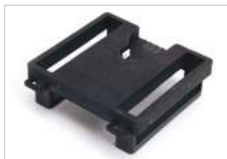
GMLN4488 Funda para cinturón Peter Jones (ILG) Klick Fast (50 mm).