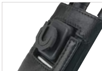
PMLN5004 Dispositivo para usar al hombro con sujetador Peter Jones (ILG) Klick Fast.