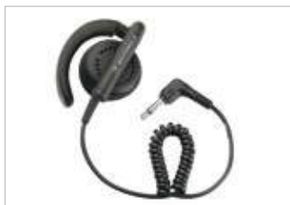
WADN4190 Aurífono flexible para recepción únicamente.