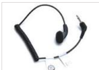
MDRLN4885 Aurífono para recepción únicamente con cubierta y cable en espiral.