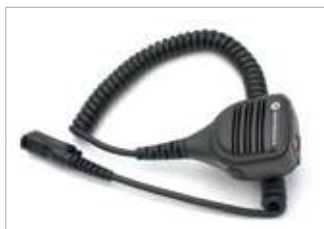
PMMN4078 Micrófono parlante remoto pequeño con entrada para audio y botón de emergencia, windporting, IP55.