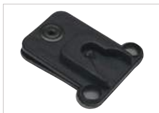
GMDN0445AA Puerto de apoyo de encastre a presión Peter Jones (ILG) Klick Fast.