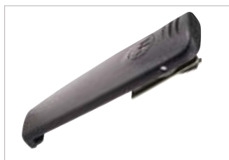
HLN9714 Presilla para cinturón de 2,5".

AL HOMBRO, AL PECHO O A LA CINTURA... USTED DECIDE. NUESTRA GAMA DE ACCESORIOS PARA EL TRANSPORTE DE EQUIPOS LO AYUDAN A MANTENER SUS MANOS LIBRES DE MODO TAL QUE SOLO DEBA CONCENTRARSE EN LA TAREA QUE TIENE A CARGO. ELIJA DE ENTRE MÚLTIPLES Y VARIADAS FUNDAS DE CUERO, CORREAS, ACCESORIOS PARA HOMBRO Y PRESILLAS PARA CINTURÓN; TODOS PENSADOS PARA PERMITIR UN FÁCIL ACCESO A SU RADIO SERIE MTP3000.