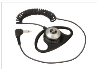
PMLN4620 Aurífono para recepción únicamente D-Shell.