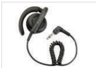
WADN4190 Aurífono flexible para recepción únicamente.