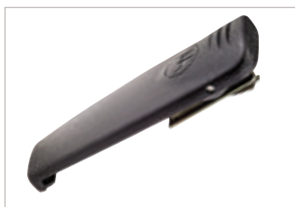
HLN9714 Presilla para cinturón de 2,5".

AL HOMBRO, AL PECHO O A LA CINTURA... USTED DECIDE. NUESTRA GAMA DE ACCESORIOS PARA EL TRANSPORTE DE EQUIPOS LO AYUDAN A MANTENER SUS MANOS LIBRES DE MODO TAL QUE SOLO DEBA CONCENTRARSE EN LA TAREA QUE TIENE A CARGO. ELIJA DE ENTRE MÚLTIPLES Y VARIADAS FUNDAS DE CUERO, CORREAS, ACCESORIOS PARA HOMBRO Y PRESILLAS PARA CINTURÓN; TODOS PENSADOS PARA PERMITIR UN FÁCIL ACCESO A SU RADIO SERIE MTP3000.