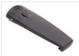
PMLN5616 Presilla para cinturón de 2".