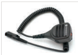
PMMN4078 Micrófono parlante remoto pequeño con entrada para audio y botón de emergencia, windporting, IP55.