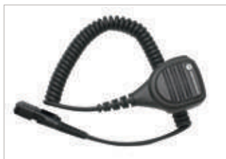
PMMN4075 Micrófono parlante remoto pequeño, windporting, IP57 No incluye botón de emergencia.