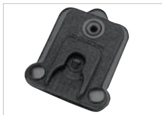
GMDN0547 Puerto de apoyo de doble lengüeta Peter Jones (ILG) Klick Fast; se conecta con dispositivo para hombro con sujetador Peter Jones (ILG) Klick Fast.