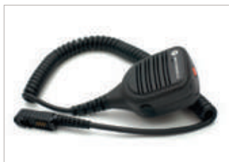
PMMN4072 Micrófono parlante remoto IMPRES grande; incluye micrófono con cancelación de ruido, mejor calidad de audio, entrada para audio y botón de emergencia, IP54.

USTED NECESITA LA MEJOR CALIDAD DE AUDIO POSIBLE PARA QUE SUS COMUNICACIONES PUEDAN SER OÍDAS DE MANERA FUERTE Y CLARA EN TODO MOMENTO. CON ESTE MICRÓFONO PARLANTE REMOTO, USTED PERMANECE SEGURO EN LAS SITUACIONES MÁS ADVERSAS