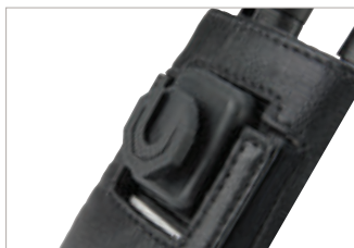
PMLN5004 Dispositivo para usar al hombro con sujetador Peter Jones (ILG) Klick Fast.