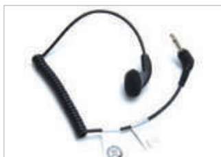
MDRLN4885 Aurífono para recepción únicamente con cubierta y cable en espiral.