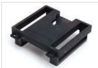
GMLN4488 Funda para cinturón Peter Jones (ILG) Klick Fast (50 mm).