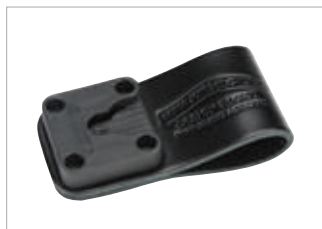
GMDN0566AC Presilla para cinturón de cuero Peter Jones (ILG) Klick Fast con puerto de montaje (50 mm); se conecta con dispositivo para hombro con sujetador Peter Jones (ILG) Klick Fast.